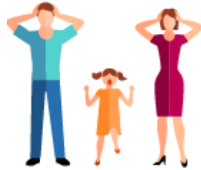
สถิติความรุนแรงในครอบครัว (ต.ค. 64-ก.ย. 65)