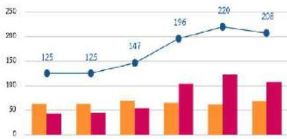
แนวโน้มความรุนแรงในครอบครัว

ในระยะ 6 เดือนที่ผ่านมา พบแนวโน้มความรุนแรงในครอบครัวเพิ่มสูงขึ้น โดยเฉพาะในช่วง 3 เดือนหลัง (พ.ย. ๒๕.๖3 และ ม.ค. ๖4) มีการเพิ่มขึ้นอย่างก้าวกระโดด จากจำนวน 147 ราย ในเดือน ต.ค.๖3 เป็น 196 ราย ในเดือน พ.ย.๖3 และเพิ่มสูงถึงระดับ 200 ราย ในเดือน ธ.ค.๖3 และ ม.ค.๖4